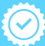
График платежей строится с учетом пожеланий заемщика, возможна отсрочка платежа